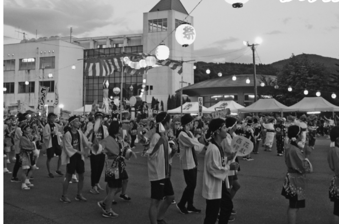
令和元年度のむろね夏まつり盆踊りに参加の様子

夏の風物詩「むろね夏まつり」と地元商店主が主催する「あきんどふれあい祭」が新型コロナウイルス感染症対策を講じ3年ぶりに次の日程で開催されます。