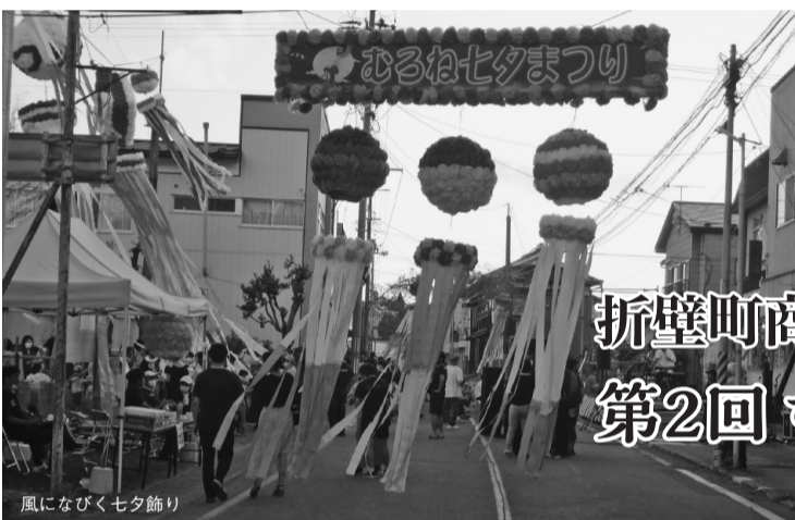
風になびく七夕飾り

発行所 一関商工会議所 室根地域運営協議会 室根町折壁字大里122-8 電話 (0191) 64-2063 FAX (0191) 64-2632