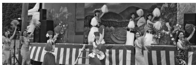
令和元年度フラ&タヒチアンダンスショー

あきんどふれあい祭を8月28日(日)サンショップ駐車場を会場に開催されます。歌や踊りなどステイジイベントなど企画しております。詳細につきましては後日チラシ等でご案内しますのでご期待下さい。