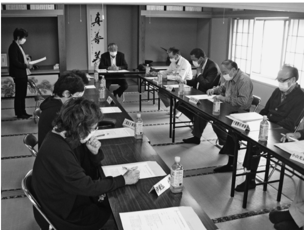
今年度事業を協議した幹事会

あきんどふれあい祭を8月28日(日)サンショップ駐車場を会場に開催されます。歌や踊りなどステイジイベントなど企画しております。詳細につきましては後日チラシ等でご案内しますのでご期待下さい。