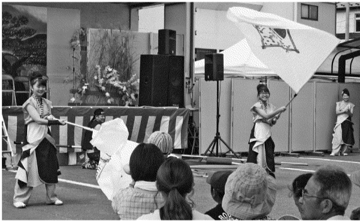
「桜室連」の女子高校生メンバーによる旗振り