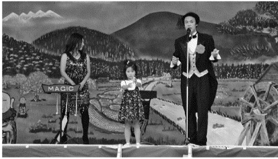
子供が参加した驚きの「マジックショー」

ト。来場者にはお楽しみ抽選券が付いたスタンプラリーの台紙が配布されました。また、同時進行には室根サービスタ店主催の「金成温泉延年園日帰り招待旅行」交換会が行われ、先着20名の方が交換しました。