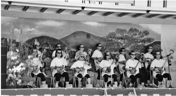
岩手県大会優勝の「藤沢サンイチ三味線」