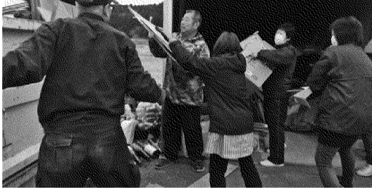
手際良くトラックに積み込む女性会員

3月25日、平成30年度の第4回リサイクル事業が行われ、会員9名が参加しました。女性会室根支部では一関市の助成制度を利用して、毎年数回の資源ごみの回収活動を行っております。回を重ねるごとに女性会のリサイクル倉庫を利用してくださる方が増え、ゴミの出し方が上手に見受けられます。今後ともご協力をよろしくお願いいたします。