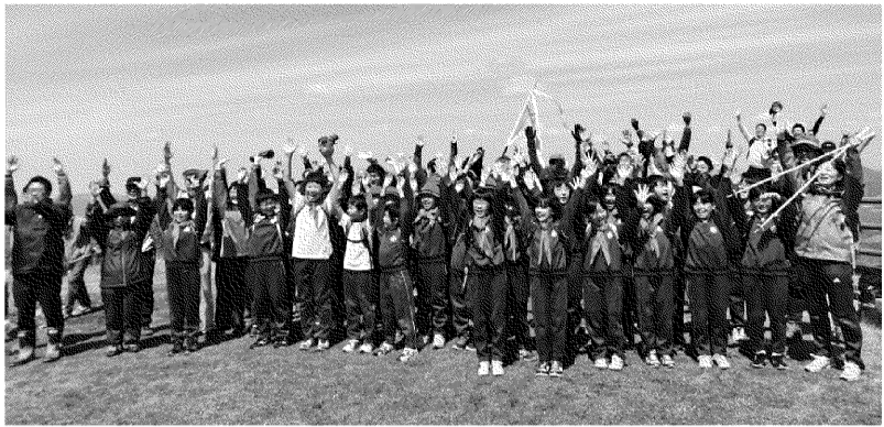
山頂で万歳三唱 室根山(895m)の山開きが4月14日に行われ、室根東・室根西両小学校の自然愛護団をはじめ、県内外から集まった登山愛好者らが晴天のもと山頂を目指しました。