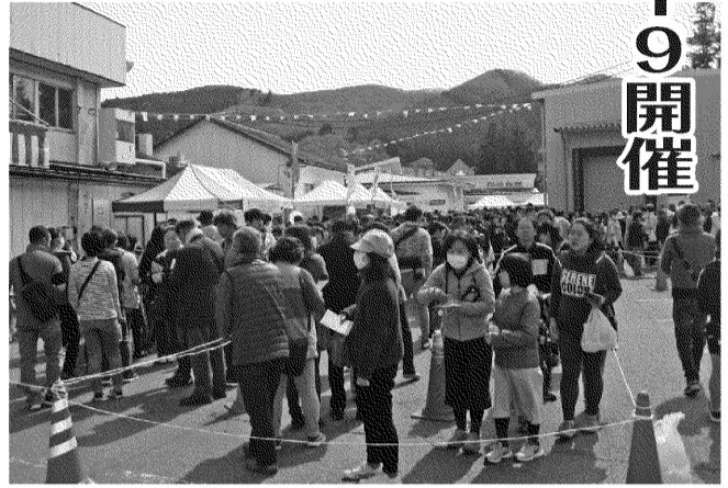
大勢の家族連れで賑わう特設会場

株式会社オヤマ(小室代表取締役社長)の「オヤマ感謝祭2019」が、4月21日(日)本社特設会場で開催されました。 この感謝祭は、地域の皆様のご支援に感謝を込めて開催するもので、今年で5周年となりました。当日は晴天に恵まれ、開催時間の9時には500台駐車可能な本会場の駐車場もいっぱいとなり、家族連れや買い物客で長蛇の列ができるほどの大盛況となりました。 会場では、からあげ