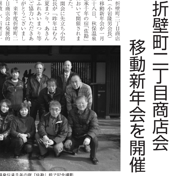
秋保温泉伝承千年の宿「佐勤」前で記念撮影

この新年会で出された意見を新たに設立される商店会の事業計画に盛り込み、今後の商店会活動に活かしていくことを申しあわせ新年会を終了しました。