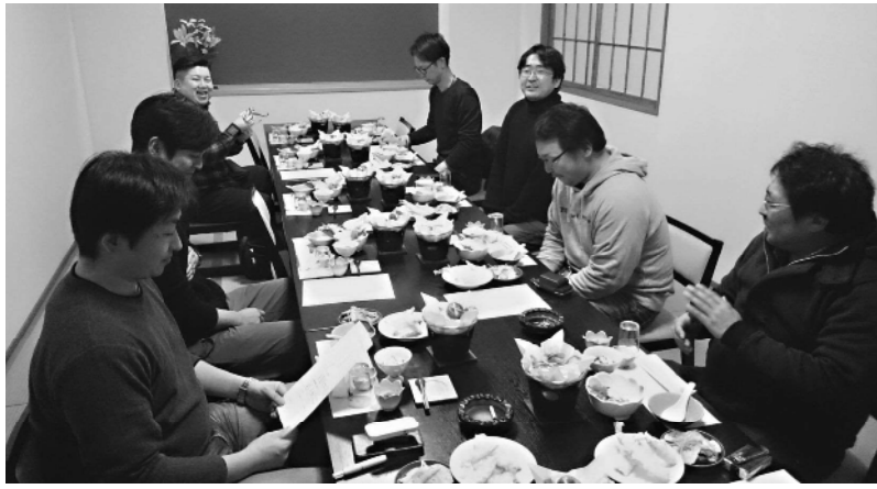
青年部室根支部新年会

一関商工会議所青年部(英司、部員十五名)では、二月三日(土)に気仙沼市田中前(四季の味処あおば)において部員十一名が参加して新年会を開催しました。