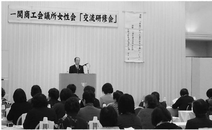
一関商工会議所女性会交流研修会

一関商工会議所女性会 成29年度一関商工会議所女性会交流研修会」を開催しました。