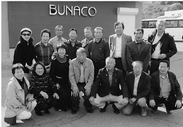
ブナコ西目屋工場にて記念撮影

懇談会では、地域の課題として、人口減少問題、商店街問題、高齢化・後継者問題、バイパス問題などについて各地域運営協議会長から意見が出されました。人口減少問題では、I.L.C誘致を人口減少の歯止めにする。若者の新規開業を補助金等の面から支援する。また、商店街問題では、地域の商店街が客のニーズに答えられない、空き店舗の情報がわかるようわからぬなどの意見がだされました。 地域課題の解決に特効薬はないが、商工会議所が地域の会員と密接に結びついて、一つ一つ努力していくことを確認しました。