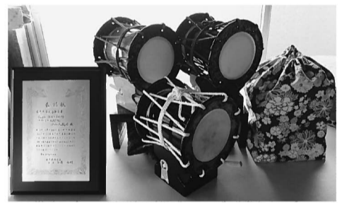
受賞した本格ミニ太鼓「想」と賞状

平成29年度いわて特産品コンクール(いわての物産展実行委員会、岩手県主催)において、室根町矢越の小山太鼓店さん作製、本格ミニ太鼓「想」が岩手県市長会会長賞を受賞しました。 このコンクールは毎年行われており、今年も土産品部門、食品部門、工芸品・生活用品部門合わせて、72社167点の応募があり、その中から岩手県市長会会長賞6点、同実行委員会会長賞9点が受賞されました。 今回見事に岩手県市長会会長賞を受賞した本格ミニ太鼓「想」は、お客様様の要望により胴の色や紐を何種類も組み合わせ