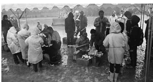
雨の中で飯ごう炊飯に取り組み児童ら

約140名が参加し、班に分かれてブロックやかまどを作り、火おこしして飯ごう炊飯をしたり、野菜を切ったりしてカレーライス調理に挑戦。薪から出る煙に悪戦苦闘しながらも大人のアドバイスを聞きながら飯ごう炊飯が楽しげに体験できました。災害時の対応を勉強していました。