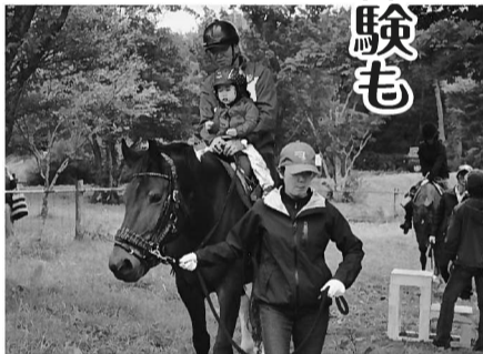
おっかなびっくり「乗馬体験」

2017室根高原牧場まつりは9月17日、室根高原ふれあい牧場で開催され、家族連れらがステージライブやふれあい動物園や乗馬体験などで動物との触れ合いを楽しみました。