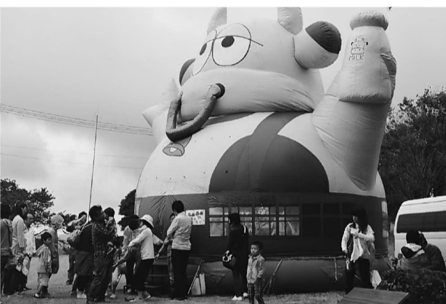
子ども達に大人気「ふあふあドーム」