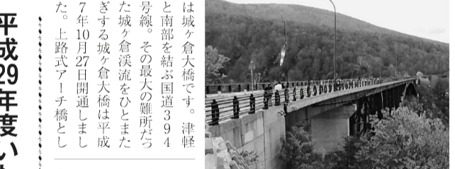
紅葉の城ヶ倉大橋

「想」が岩手県市長会会長賞受賞 特典が与えられます。商品に対するお問い合わせは小山太鼓店 TEL 六四二〇五六、FAX 六四二〇三六、E-MAIL info@oyamatoko.com お土産、八戸名物が勢揃いし、約60店舗が軒を連ねる大きな郊外型食品市場です。平日にもかかわらず八食センターは、観光客や地元の買い物客で大賑わい。参加者も両手いっぱいにお土産を抱え帰路につきました。 今回の視察では、移転した小学校の旧校舎を活用した工場を見学しました。室根地域でも少子化により小学校などの公共施設の統廃合が進むことが予想されます。今回の視察が公共施設の利活用のヒントになるのではないかと考えました。