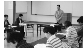
総会に先立ち挨拶する大房会長