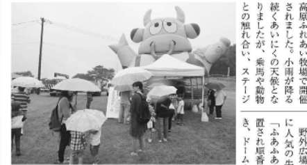
子ども達に大人気 ふあふあドーム