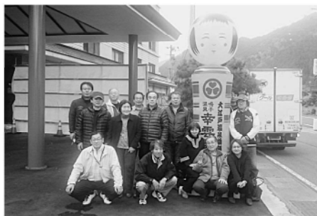
親子温泉「幸福園」前にて

サービス店会を 展開して行き ます。その後親子温 泉、途中、道の駅や 大船山観光物産センタ ーなどを視察し帰路に なりました。