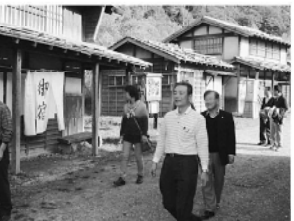
映画村オーブセット内を散策