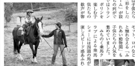
小さな子ども大丈夫 乗馬体験