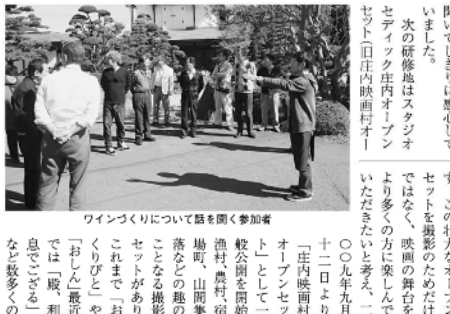
ワイフづくりについて話を聞く参加者