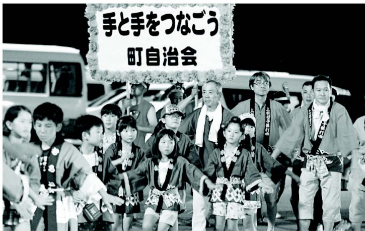
みんなで輪になり踊りました!!

当日は夏!夏!夏!を強調するような暑い、まつり日和となり、人も多く賑やかなイベントや盆踊りで楽しみました。まつり会場には特設ス