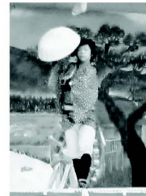
沢夢虎舞踊若手のホープ!