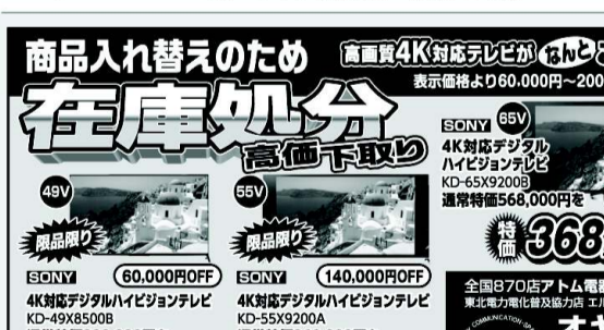
きれいになった駅舎前にて笑顔の参加者

きれいな駅舎でお出迎え。室根LC奉仕活動。もと折壁駅と新月駅に分かれ、駅舎の窓ガラスの拭き掃除、蛍光灯の汚れ落とし、床の掃除、駅内の植木の手入れや草刈り等を行いました。