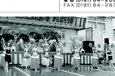
雨天を忘れさせた魅惑のフラ&タヒチアンダンスショー