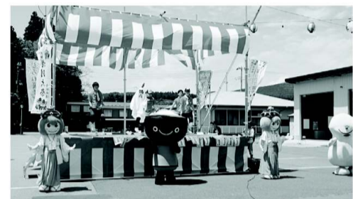
もちもちとおぼけのソッチも応援に来てくれました!

当日は食品衛生指導員と役員が四班に分かれて室根町内の会員事業所を一軒ずつ廻り、「食中毒予防の三原則(清潔、迅速、加熱又は冷却)」について