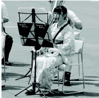
涼やかな浴衣姿で演奏する室中生

「新しい手洗いで食中毒予防!」室根食品衛生連絡会。当日は食品衛生指導員と役員が四班に分かれて室根町内の会員事業所を一軒ずつ廻り、「食中毒予防の三原則(清潔、迅速、加熱又は冷却)」について