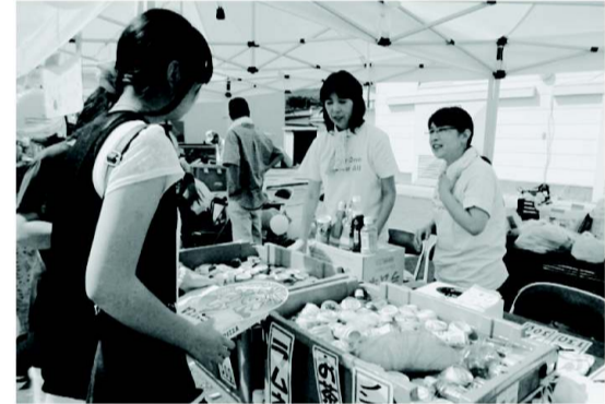
暑いですなぁ〜何にしますか? 女性会売店

「新しい手洗いで食中毒予防!」室根食品衛生連絡会。当日は食品衛生指導員と役員が四班に分かれて室根町内の会員事業所を一軒ずつ廻り、「食中毒予防の三原則(清潔、迅速、加熱又は冷却)」について