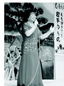
会場を魅了した美声・洋壁の母、

今年度は昨年引き続き第十八回あきんどふれあい祭は八月三十日(日)サンショップ駐車場を会場に開催されました。今回は例年消費者への感謝の気持ちを伝えると共配された雨が前日の準備として当日までも続き、関係者を悩ます雨模様の中での開催となりました。 午前十時よりスタートする予定でしたが、雨対策で臨時の屋根の設置のため十五分遅れでの開催となりました。 会場には悪天候にも関わらず続々と足を運ばれる大勢のお客様。関係者一同「感謝、感謝」の声を上げていました。 満点カード4枚での交換会で二十三名が決定しました。 次にサイコロの出た目の数だけ箱ティッシュがもらえる「サイコロティッシュ」。続いてじゃんけん。中盤は大船渡市から出演いただいた「チンドン寺町一座」一行。軽快な楽器で特設ステージ