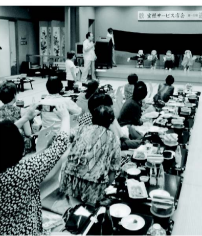
さまざまなアトラクションを楽しむ招待者のみなさん

このイベントは、今年のおきんどふれあい祭りスコットキャラクター「ハラ美ちゃん」のシルエット、そしてなじよったべ隊の活動を英文刺繍で仕上げたおしゃれなデザインに仕上がりました。これからは「いちのせき」をモチーフにご活躍されますことを期待しております。