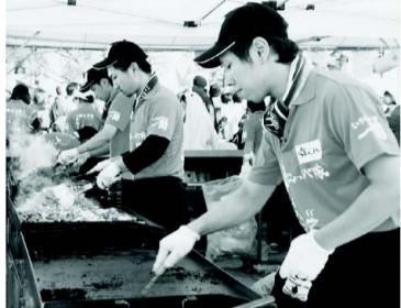
休む間もなく焼き続けた焼き担当のメンバー

私達いちのせきハラミ焼なじよったべ隊が過日の「B-1グランプリ」郡山」初出展に際しましては多くの方々の応援・支援をいただき、無事に終えられたことを報告させていただきます。