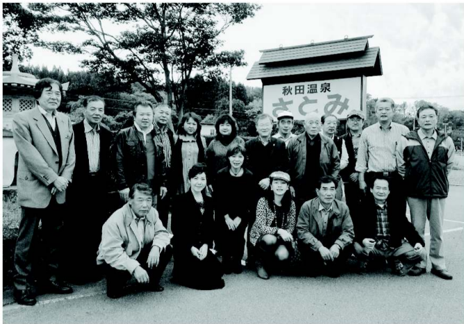
秋田温泉「さとみ」の美人女将さんを囲んで(女将:前左から二人目)