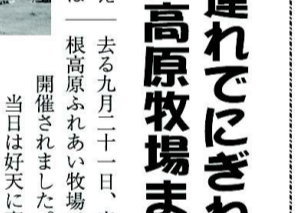
今年で第四回目を迎えた「室根高原牧場まつり」