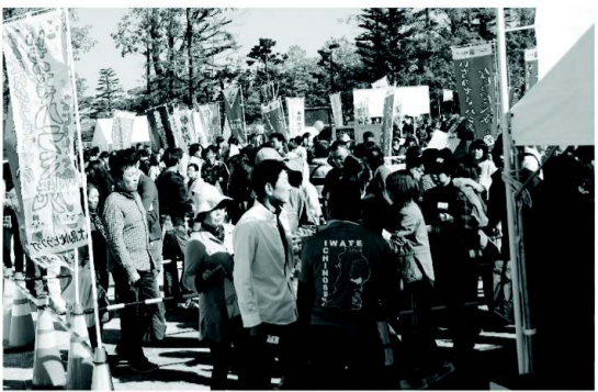
なじよったべ隊のテント前に大勢の来場者

本日の活動につきましては先日発行された広報いちのせき十一月号に特集されていますので、ここでは割愛させていただきます。