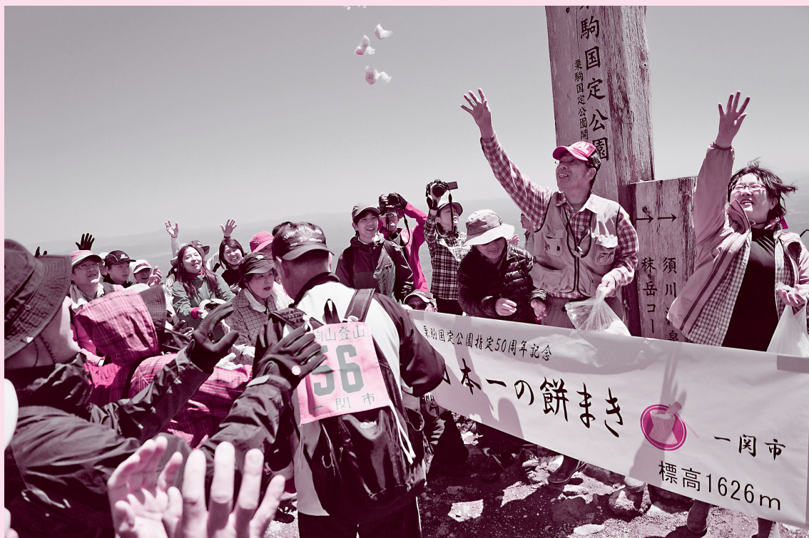
日本一の餅まき～栗駒山山開き～