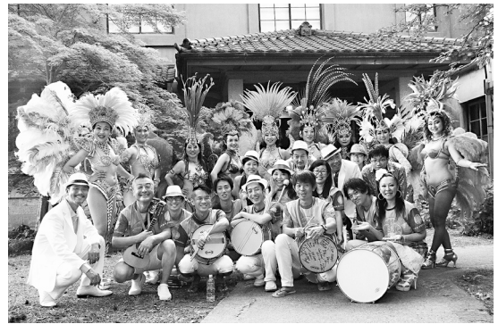
サンバチーム「G. R. E. S フェスタンサ」