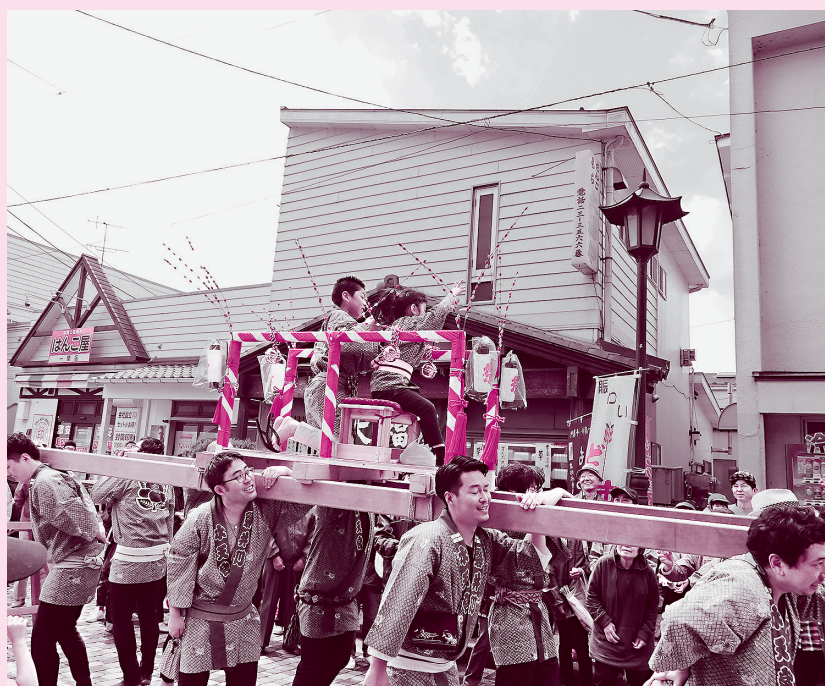
5月5日、ど市のオープニングセレモニー